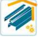
Geländer und Metallbau