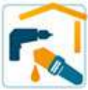
Trockenbau / Renovierung