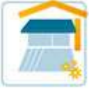
Beschattung / Markisen