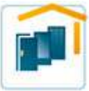
Türen und Vordächer