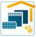
Zaun und Toranlagen